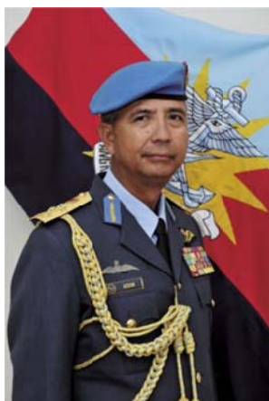
Командующий вооруженными силами генерал Азизан Арифин (Tan Sri Azizan Ariffin).

Родился 25 октября 1952 года в Яне (Yan, штат Кедах). Назначен 1 сентября 2009 года. До назначения с 30 октября 2006 года занимал должность командующего ВВС.