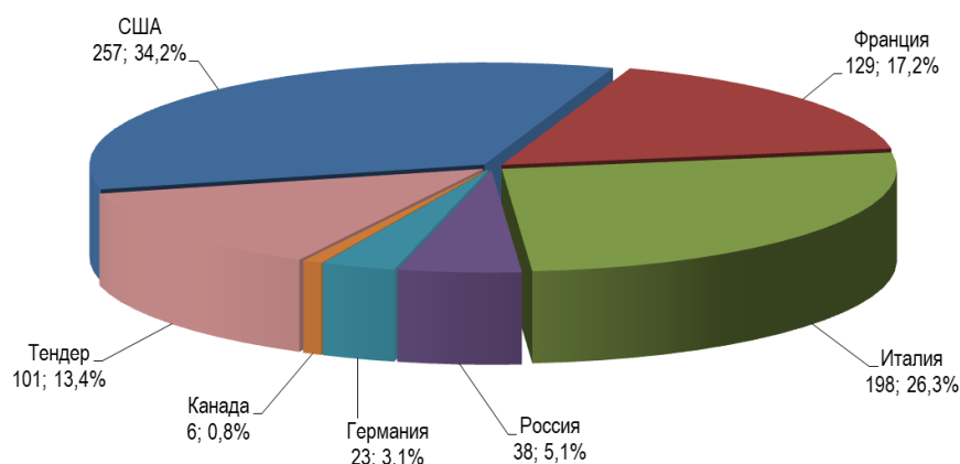
Сводная таблица экспорта многоцелевых вертолетов в 2020-2027 гг. (млн. долл. в текущих ценах)